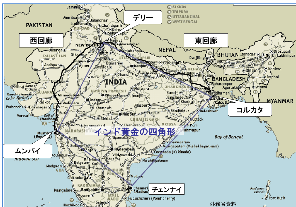
<図3 貨物新線建設計画 外務省作成資料>

Freight Corridor(DFC)である。この貨物新線に沿って6州があるが、各州が4つずつ計24の産業クラスターを建設し、デリーとムンバイを結ぶ産業大動脈を建設するという構想(Delhi Mumbai Industrial Corridor; DMIC)も軌道に乗りつつある。インドは、DMIC 公社を設立し、わが国の国際協力機構(JICA)の調査に従って国際協力銀行(JBIC)はすでに融資を開始した。さらに、この産業大動脈には4つのスマート・コミュニティを建設する構想があり、それぞれ3~4の代表的日本企業グループが建設を担当することになっている。