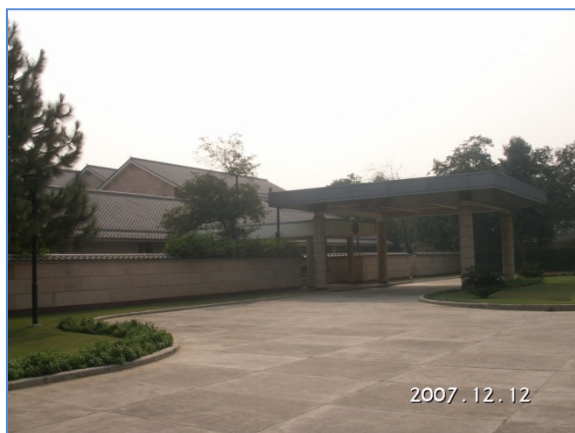
<日本大使公邸>

インド政府は、ニューデリーの南部チャナキャプリ(古代モーリア王朝の政治家・思想家チャナキアから命名)地区に諸国の大使館を集めた外交団地を造成したが、中心部の一画を日本政府に供与した。現在この土地には、大使館事務所と大使公邸があるが(下記写真)、同じ並びには北からインドにとって重要な英国、オーストラリア、パキスタン、日本、ドイツなど、広い道路を隔てた反対側には中国、米国、フランス、カナダなどの重要国の大使館がある。4年8ヶ月間、この広大な敷地に住んで働いた筆者は、ネルー政府の日本に対する好意のあらわれを実感した。